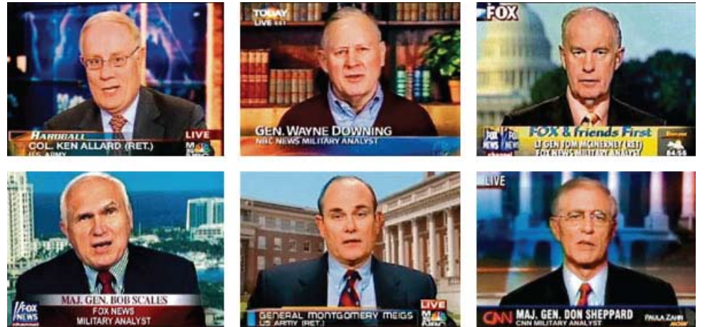
Militaire 'experts' op TV rechtstreeks betaald door het Pentagon. Dit ontdekte de New York Times.

► P.2 GOOGLE BILDERBERG CFR RONDE TAFEL TAVISTOCK GELD ALS SCHULD YOUTUBE ■